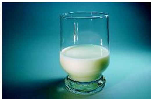
Bewaar de tand in melk