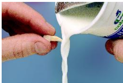
Spoel de tand af met melk