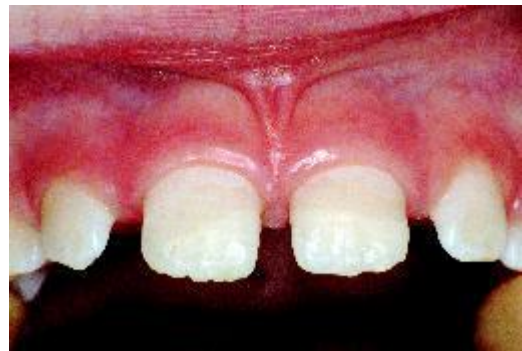
... en hersteld