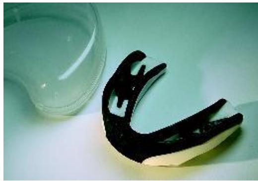
Gebitsbeschermer, te koop in sportwinkels

Gebitsletsel kunt u soms voorkomen. Tijdens het sporten kunt u bijvoorbeeld een gebitsbeschermer dragen. Die biedt geen garantie, maar kan de eventuele schade bij een ongeluk beperken. Er bestaan verschillende soorten beschermers. Kant-en-klare zijn te koop in sportwinkels. Deze passen vaak niet goed en beschermen daarom onvoldoende. Het beste werkt de gebitsbeschermer die precies op maat is gemaakt door uw tandarts.