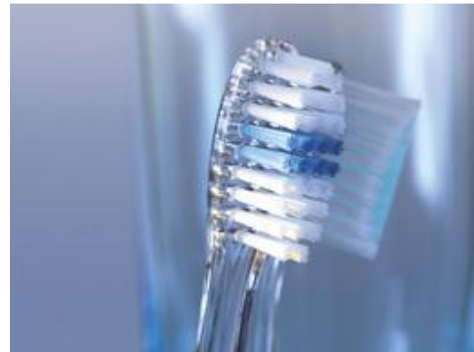
Gebruik een zachte tandenborstel

Poets twee maal per dag uw tanden en kiezen zorgvuldig met een zachte tandenborstel. U oefent voldoende druk uit als u de borstel aan het eind van het handvat vasthoudt tussen uw duim en de toppen van uw vingers. Poets alle plekken in de mond even goed. De eerste tand of kies die u poetst slijt vaak het meest. Als u tandenstokers of ragers gebruikt, beperk dit dan tot één keer per dag. Eet of drink één uur voordat u uw tanden poetst geen zure producten.