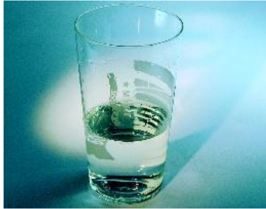
Neutraliseer zuur met water, melk of kaas

Neem in plaats van zure producten of na gebruik ervan een glas water of melk, of een klein stukje kaas. Zo voorkomt of beperkt u de schadelijke invloed van zuren.