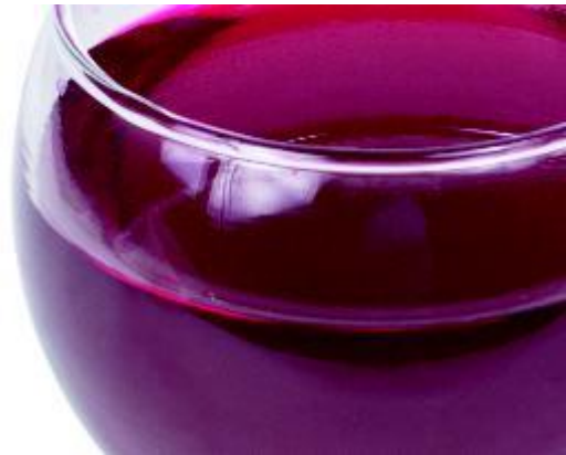
Zuur zit onder andere in wijn ...

Zuren in voeding en dranken kunnen tanderosie veroorzaken. Zuur zit onder andere in (sinaas)appels, citroenen, grapefruit, kiwi's, vruchtensappen, (light)frisdranken (ook ijsthee), wijn en bijvoorbeeld breezers. Tanderosie is een sluipend proces dat niet gemakkelijk te herstellen is. Het gaat niet alleen om hoevél zure producten u eet en drinkt. Het gaat vooral om hoe vaak, hoe lang, de tijdstippen en de manier waarop u dat doet. Wanneer tanderosie niet wordt bestreden, kunnen zuren het tandglazuur en vervolgens zelfs het blootliggende tandbeen oplossen. Zie verder wat veroorzaakt tanderosie?