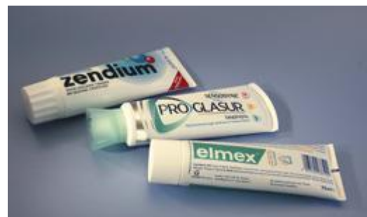
Gebruik een niet-schurende tandpasta

Veel voedingsmiddelen bevatten zuren. Speeksel heeft een beschermende werking. Het neutraliseert de zuurinwerking op het gebit. Eet u de hele dag door zure producten, dan kan het speeksel die aanvallen op het gebit niet meer neutraliseren. Niet alleen om tanderosie te voorkomen, maar ook om de kans op gaatjes te verkleinen geldt: beperk het aantal keren dat u eet of drinkt. Gebruik drie maaltijden per dag en daarnaast niet meer dan vier keer iets tussendoor. Water zonder prik, koffie en gewone thee zonder suiker zijn niet schadelijk voor uw gebit.