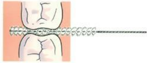
De rager volgt de vorm van de kies

Ragers zijn er in verschillende soorten en dikten. Sommige ragers hebben een lange spiraalborstel, andere hebben een kort borsteltje dat in een handvat of houder wordt vastgezet. Overleg met uw tandarts of mondhygiënist welke rager u het beste kunt gebruiken. In het begin is het gebruik van ragers soms moeilijk en pijnlijk. Het tandvles gaat dan gemakkelijk bloeden omdat het nog ontstoken is. Als u de rager dagelijks gebruikt, verdwijnt de ontsteking en dus ook het bloeden. Bovendien wordt het gebruik minder pijnlijk. Bloedend tandvles kan ook het gevolg zijn van een verkeerde techniek. Wordt het bloeden niet minder of juist erger? Ga dan naar uw tandarts of mondhygiënist.