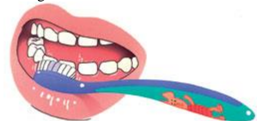
2. Dan de buitenkant