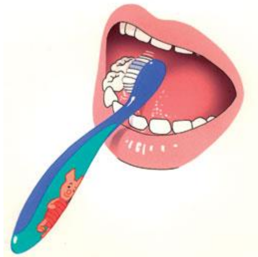
1. Begin beneden met de binnenkant.

Zet de tandenborstel recht op de tanden. Poets zachtjes en maak korte horizontale bewegingen. Op deze wijze poetst u de schadelijke tandplak weg. Als u een vaste volgorde aanhoudt, leert u uw kind systematisch poetsen. Zo is er minder kans dat u plekjejes overslaat. Begin achteraan bij de kiezen en ga via de tanden naar de kiezen aan de andere kant. Neem er de tijd voor. Voor poetsen met een elektrische borstel geldt hetzelfde. U hoeft alleen zelf geen poetsbewegingen te maken. U kunt de borstel langzaam over de tanden en kiezen opschuiven. Poets ook na als uw kind een elektrische tandenborstel gebruikt. Poets volgens de 3 B's: B innenkant, B uitenkant, B ovenop.