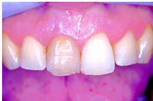
Verkleuring door een dode tand

2. Het verouderingsproces. Uw glazuurlaag wordt dunner en de laag tandbeen dikker. Er komen barsten