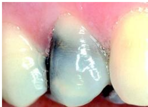
Verkleuring door grijze of zwarte vulling