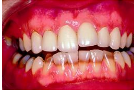
Verkleuring door ontwikkelingsstoornissen in de tandkiem

4. Ontwikkelingsstoornissen in het allereerste begin van een tand (tandkiem) of het gebruik van geneesmiddelen op jonge leeftijd. Deze verkleuringen zijn vaak bandvormig of vlekachtig. De tandarts kan dergelijke verkleuringen wegslijpen en herstellen met een tandkleurig vulmateriaal.