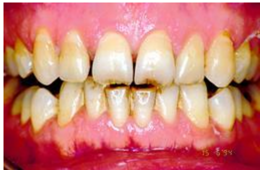
Verkleuring door verouderingsproces