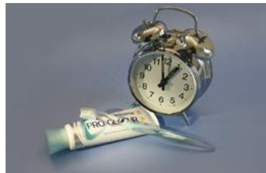
Gebruik geen zure producten één uur voor het tandenpoetsen