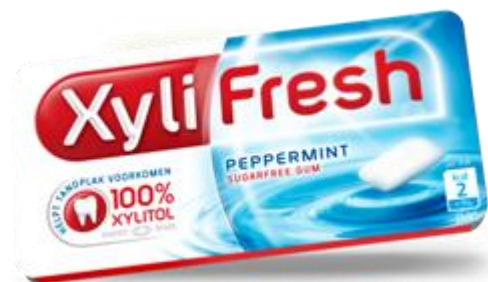
Kies suikervrije kauwgom